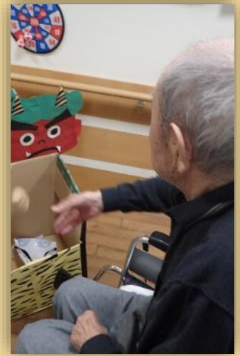
お見事！！ 速球ストライク！